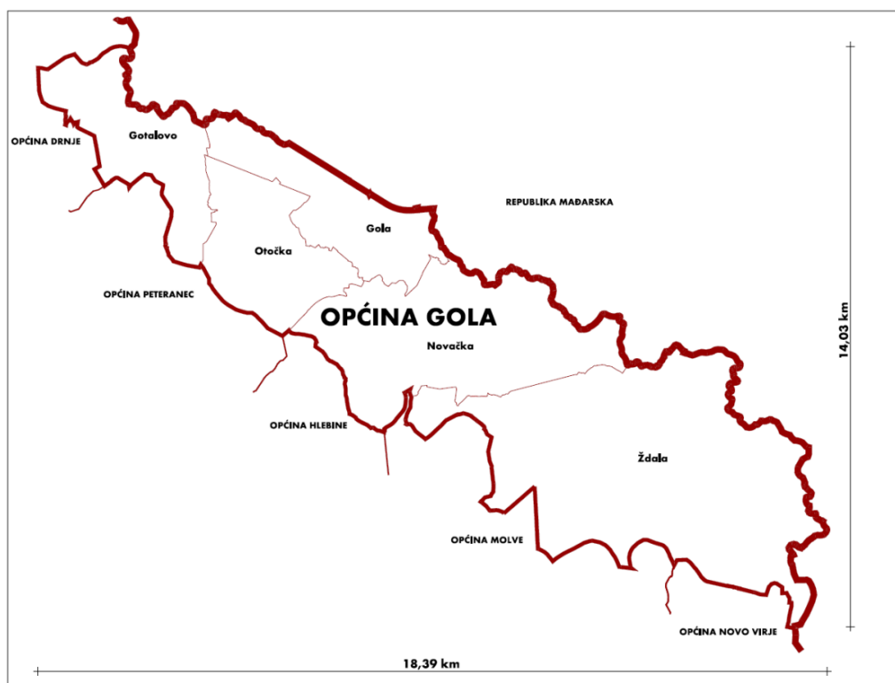
Prikaz 2 Granice naselja unutar Općine

Granice naselja se načelno ne poklapaju s granicama katastarskih općina niti s granicama katastarskih čestica, odnosno postoji mali odmak od katastra koji je vjerojatno tehničke prirode.