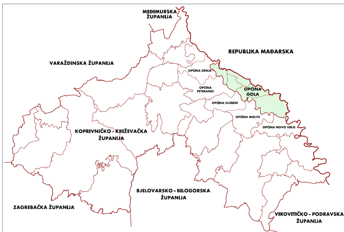
Prikaz 1 Prikaz Općine u odnosu na Županiju